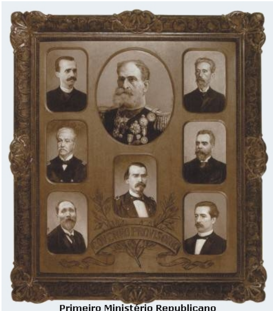
Primeiro Ministério Republicano