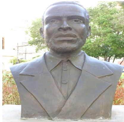
JOÃO DE DEUS DO NASCIMENTO NASCEU NA VILA DE NOSSA SENHORA DO ROSÁRIO DO PORTO DA CACHOEIRA, EM 1771, FILHO DE JOSÉ DE ARAÚJO E FRANCISCA MARIA.